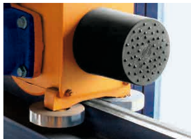
Guide rollers on the high level end carriage as standard.