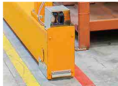
Obstacle detection on the floor level end carriage as standard and no guide rail on the floor required.

Архангельск (8182)63-90-72 Астана (7172)727-132 Астрахань (8512)99-46-04 Барнаул (3852)73-04-60 Белгород (4722)40-23-64 Брянск (4832)59-03-52 Владивосток (423)249-28-31 Волгоград (844)278-03-48 Вологда (8172)26-41-59 Воронеж (473)204-51-73 Екатеринбург (343)384-55-89 Иваново (4932)77-34-06